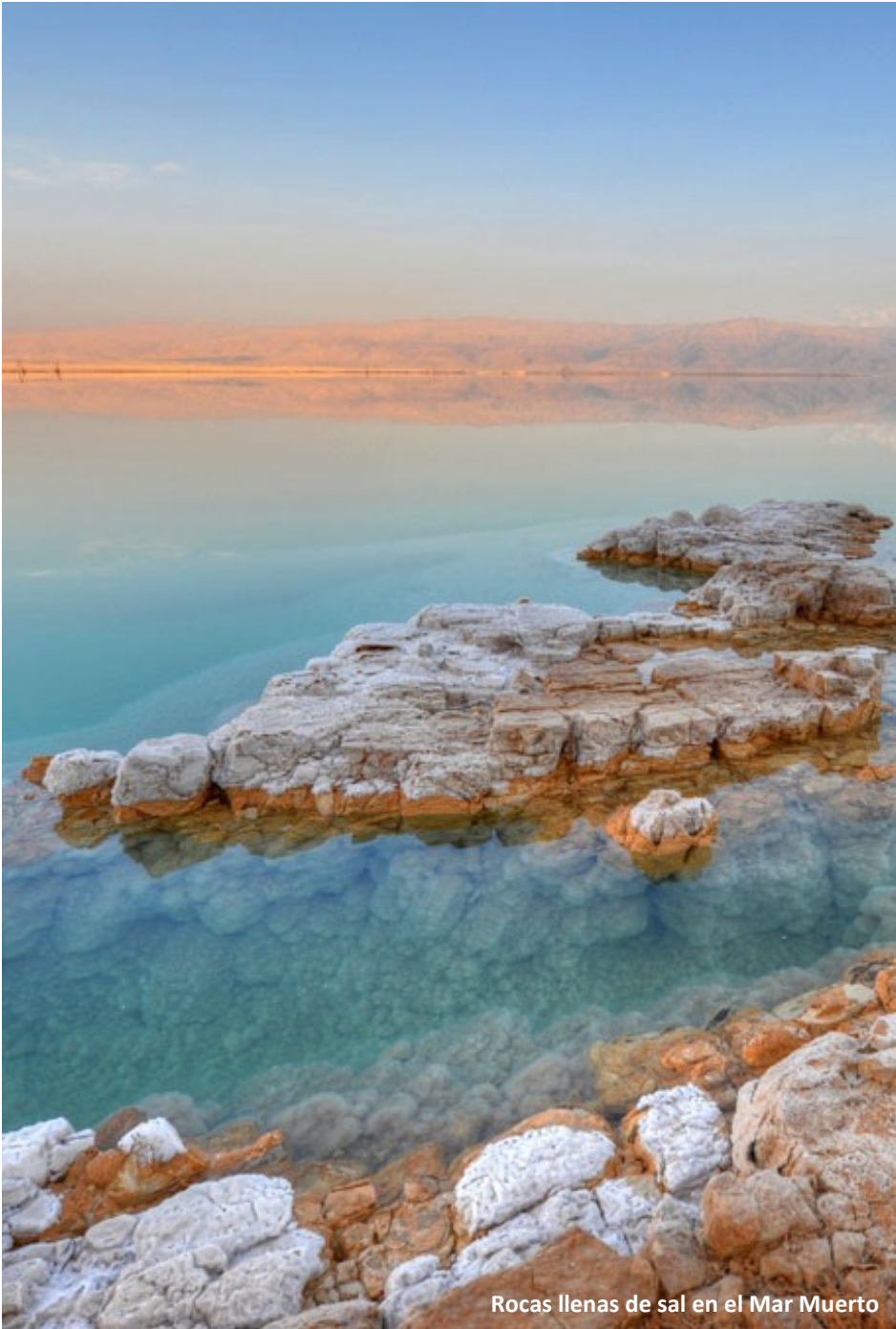
Rocas llenas de sal en el Mar Muerto